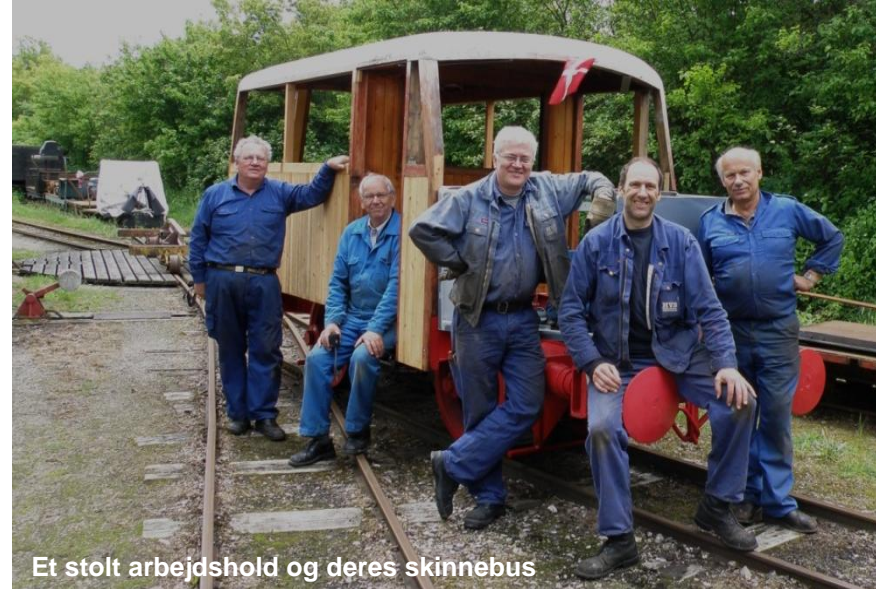
Et stolt arbejds hold og deres skinnebus

Der er også tid til at spise frokost og hygge sig sammen!